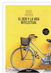
OCIO Y LA VIDA INTELLECTUAL, EL PIEPER, JOSEF