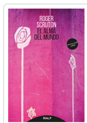
ALMA DEL MUNDO SCRUTON, ROGER