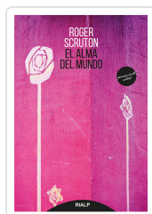
ALMA DEL MUNDO SCRUTON, ROGER