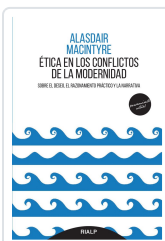
ÉTICA EN LOS CONFLICTOS DE LA MODERNIDAD. SOBRE EL DESEO EL MACINTYRE, ALASDAIR