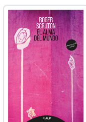
ALMA DEL MUNDO SCRUTON, ROGER