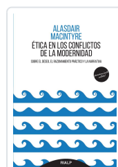
ÉTICA EN LOS CONFLICTOS DE LA MODERNIDAD. SOBRE EL DESEO EL MACINTYRE, ALASDAIR