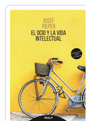
OCIO Y LA VIDA INTELLECTUAL, EL PIEPER, JOSEF