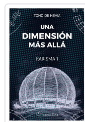
Una dimensión más allá De Hevia, Tono