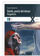
DANTE POETA DEL DESEO. PURGATORIO NEMBRINI, FRANCO