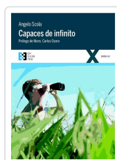
CAPACES DE INFINITO SCOLA, ANGELO