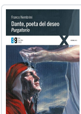
DANTE POETA DEL DESEO. PURGATORIO NEMBRINI, FRANCO