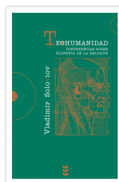
TEOHUMANIDAD SOLOVIOV, VLADIMIR