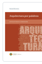
ARQUITECTURA POR PALABRAS DE MOLINA, SANTIAGO