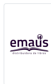
COMENTARIOS BIBLICOS. 5