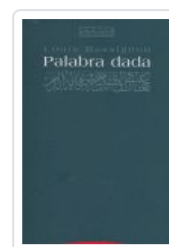
PALABRA DADA MASSIGNON, L