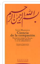
CIENCIA DE LA COMPASION, LA MASSIGNON, LOUIS