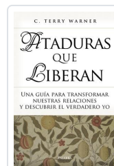
ATADURAS QUE LIBERAN WARNER, C. TERRY