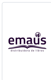
HACER FAMILIA. ENERO