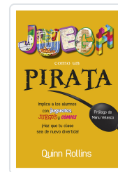
JUEGA COMO UN PIRATA ROLLINS, Q.