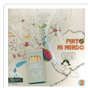
PINTO MI MUNDO 2 POTOLO BAT, MUXOTE