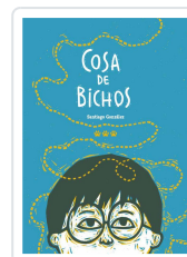
COSA DE BICHOS GONZALEZ, SANTIAGO