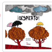
DESPIERTO! PAGON CORDOBA, MAR / AGUIRRE CARBALLIDO,