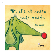
WILLI EL PERRO CASI VERDE FLORES MARCO, EDU