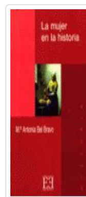
MUJER EN LA Hª, LA BEL BRAVO