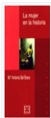
MUJER EN LA Hª, LA BEL BRAVO