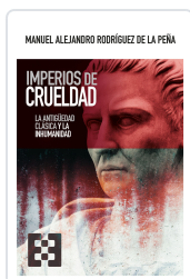
IMPERIOS DE CRUELDAD RODRÍGUEZ DE LA PEÑA, M.ALEJANDRO