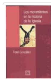
MOVIMIENTOS EN LA Hª DE LA IGLESIA GONZALEZ, FIDEL