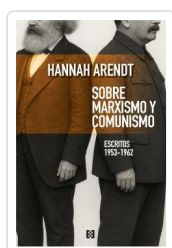
SOBRE MARXISMO Y COMUNISMO ARENDR, HANNAH