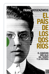
PAIS DE LOS DOS RIOS ROSENZWEIG, FRANZ