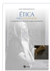
Ética para inconformes Juan Fernando Sellés Dauder