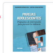
PAREJAS ADOLESCENTES SORIANO AYALA, ENCARNACION / LOZANO MART