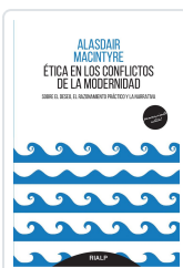
ÉTICA EN LOS CONFLICTOS DE LA MODERNIDAD. SOBRE EL DESEO EL MACINTYRE, ALASDAIR