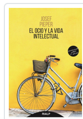
OCIO Y LA VIDA INTELLECTUAL, EL PIEPER, JOSEF