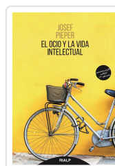
OCIO Y LA VIDA INTELLECTUAL, EL PIEPER, JOSEF