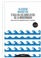
ÉTICA EN LOS CONFLICTOS DE LA MODERNIDAD. SOBRE EL DESEO EL MACINTYRE, ALASDAIR