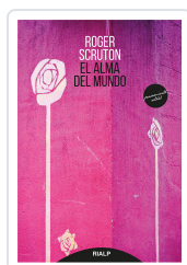
ALMA DEL MUNDO SCRUTON, ROGER