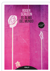
ALMA DEL MUNDO SCRUTON, ROGER