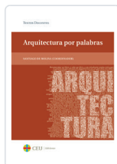
ARQUITECTURA POR PALABRAS DE MOLINA, SANTIAGO