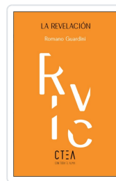
LA REVELACION Guardini, Romano