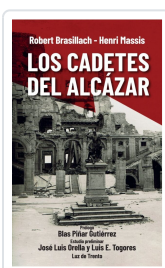
Los cadetes del Alcázar Robert Brasillach