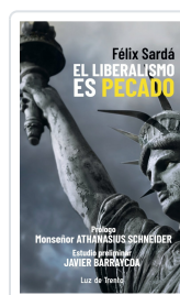
El liberalismo es pecado Félix Sardá y Salvany