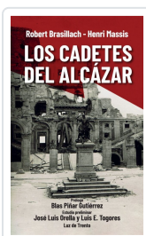
Los cadetes del Alcázar Robert Brasillach