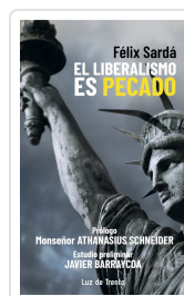
El liberalismo es pecado Félix Sardá y Salvany