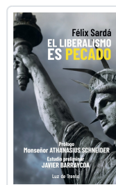
El liberalismo es pecado Félix Sardá y Salvany