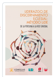
Liderazgo de discernimiento eclesial: Método LIDE LIDE, Equipo