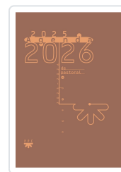
AGENDA DE PASTORAL 2025-2026 PPC PPC