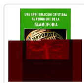
UNA APROXIMACION CRISTIANA AL FENOMENO DE LA ISLAMOFOBIA LOPEZ LAGUNA, GERARDO