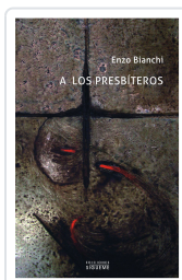
A LOS PRESBITEROS BIANCHI, ENZO