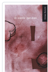
CANTO DEL PAN, EL RONCHI, ERMES