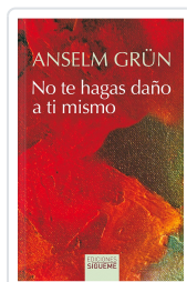
No te hagas daño a ti mismo Anselm Grün