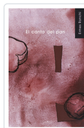
CANTO DEL PAN, EL RONCHI, ERMES