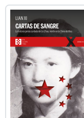
CARTAS DE SANGRE XI, LIAN