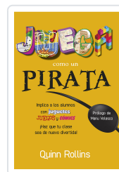
JUEGA COMO UN PIRATA ROLLINS, Q.