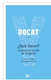
DOCAT +QUE HACER?