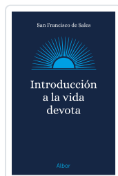
INTRODUCCION A LA VIDA DEVOTA SAN FRANCISCO DE SALES