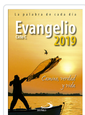
EVANGELIO 2019 (SP) EQUIPO SAN PABLO