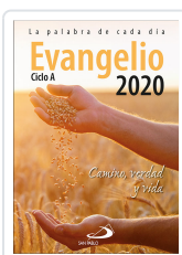
EVANGELIO 2020 (SP) EQUIPO SAN PABLO