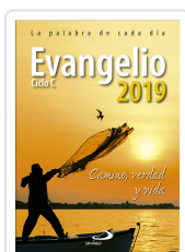
EVANGELIO 2019 LG (SP) EQUIPO SAN PABLO