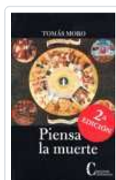
PIENSA LA MUERTE MORO, ROMAS