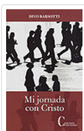
MI JORNADA CON CRISTO BARSOTTI,DIVO