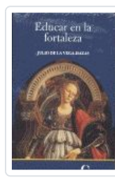
EDUCAR EN LA FORTALEZA VEGA-HAZAS,JULIO DE LA