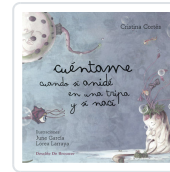
CUENTAME CUANDO SI ANIDE EN UNA TRIPA Y SI NACI CORTES, CRISTINA