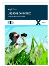
CAPACES DE INFINITO SCOLA, ANGELO