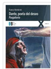
DANTE POETA DEL DESEO. PURGATORIO NEMBRINI, FRANCO