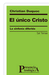
UNICO CRISTO, EL DUQUOC, C.