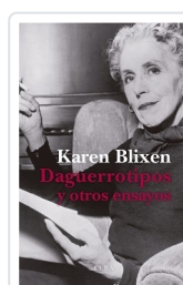
Daguerrotipos y otros ensayos Blixen, Karen