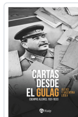
Cartas desde el Gulag Lósev, Alexei Fyodorovich ; Losev, Valentina