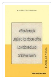
VITA AELREDI RIEVAL, ELREDO DE