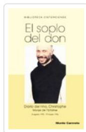
SOPLO DEL DON, EL