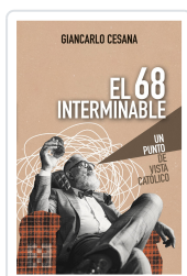
El 68 interminable Giancarlo Cesana