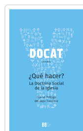
DOCAT +QUE HACER?