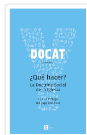
DOCAT +QUE HACER?