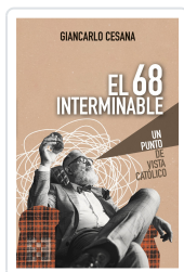
El 68 interminable Giancarlo Cesana