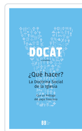
DOCAT +QUE HACER?