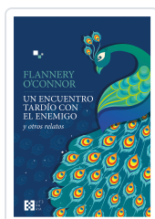
Un encuentro tardío con el enemigo O'Connor, Flannery