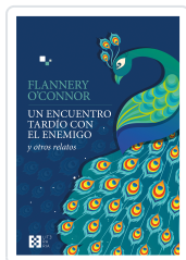
Un encuentro tardío con el enemigo O'Connor, Flannery