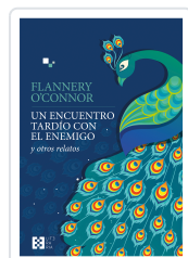
Un encuentro tardío con el enemigo O'Connor, Flannery