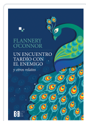
Un encuentro tardío con el enemigo O'Connor, Flannery