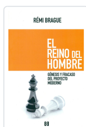
REINO DEL HOMBRE, EL BRAGUE REMI