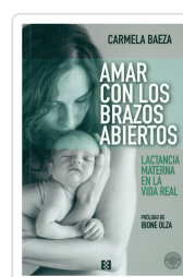
AMAR CON LOS BRAZOS ABIERTOS (NUEVA ED.) BAEZA, C.