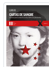
CARTAS DE SANGRE XI, LIAN