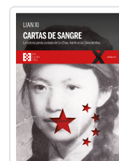
CARTAS DE SANGRE XI, LIAN